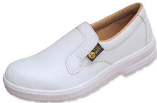
图 3 防静电脚腕带（左）和防静电鞋（右）